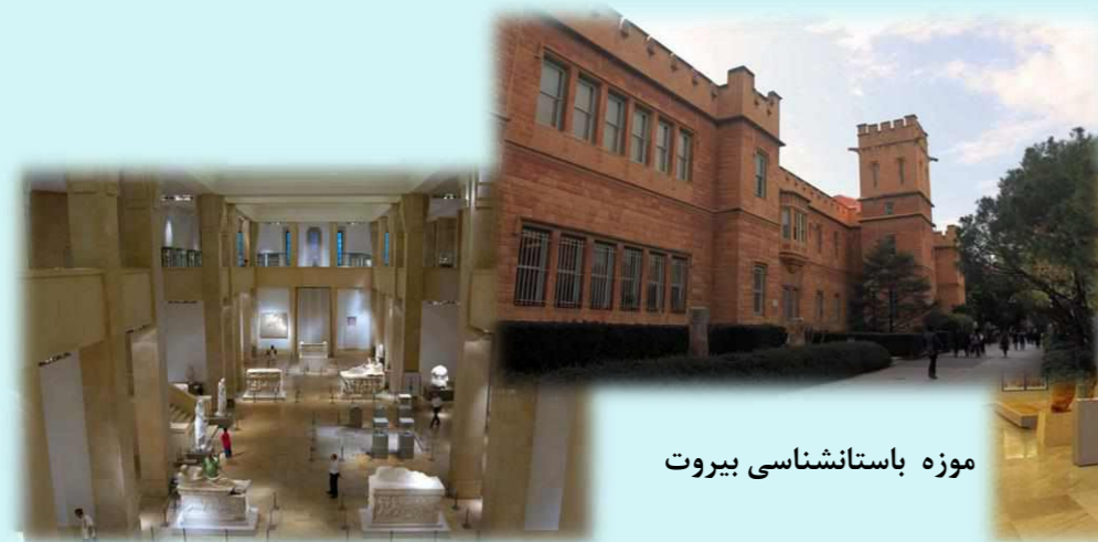
موزہ باستانشناسی بیروت